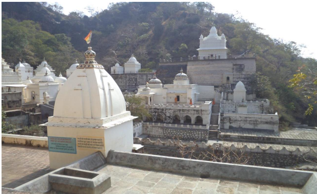
Jain Temple at Muktagiri 2016