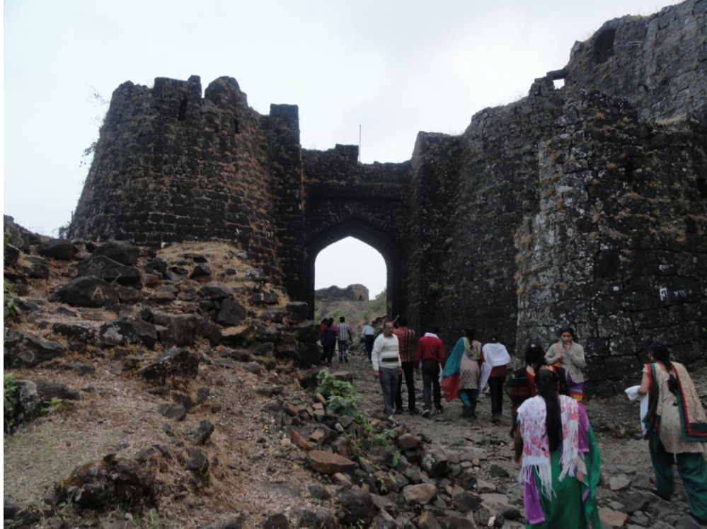
Gavilgad Fort at Chikhaldara