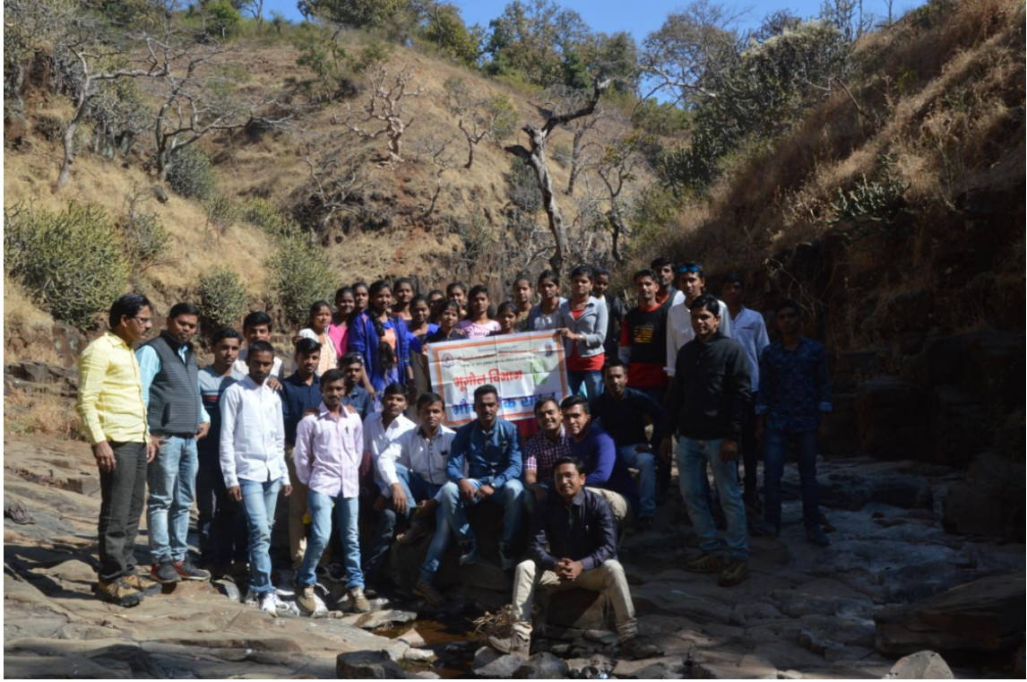
Study Tour Chikhaldara 2018