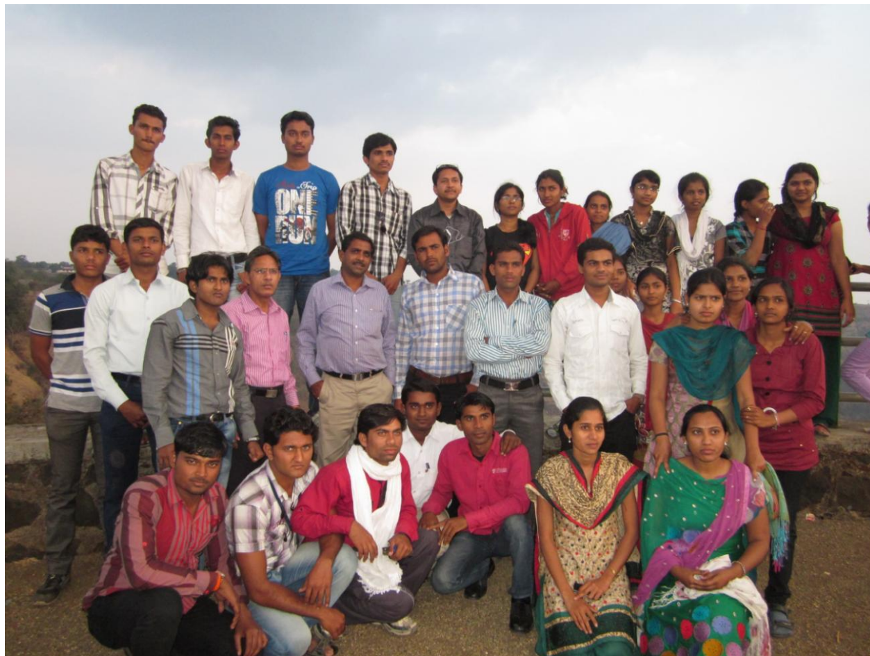
Study Tour at Chikhaldara 2016