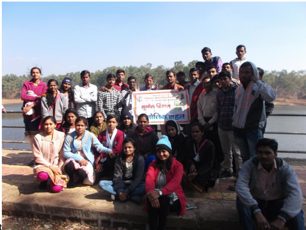
Study Tour at Chikhaldara 2016