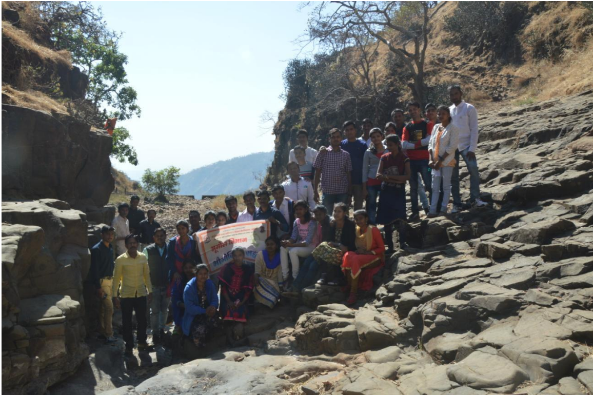
Rock structure at Chikhaldara 2018