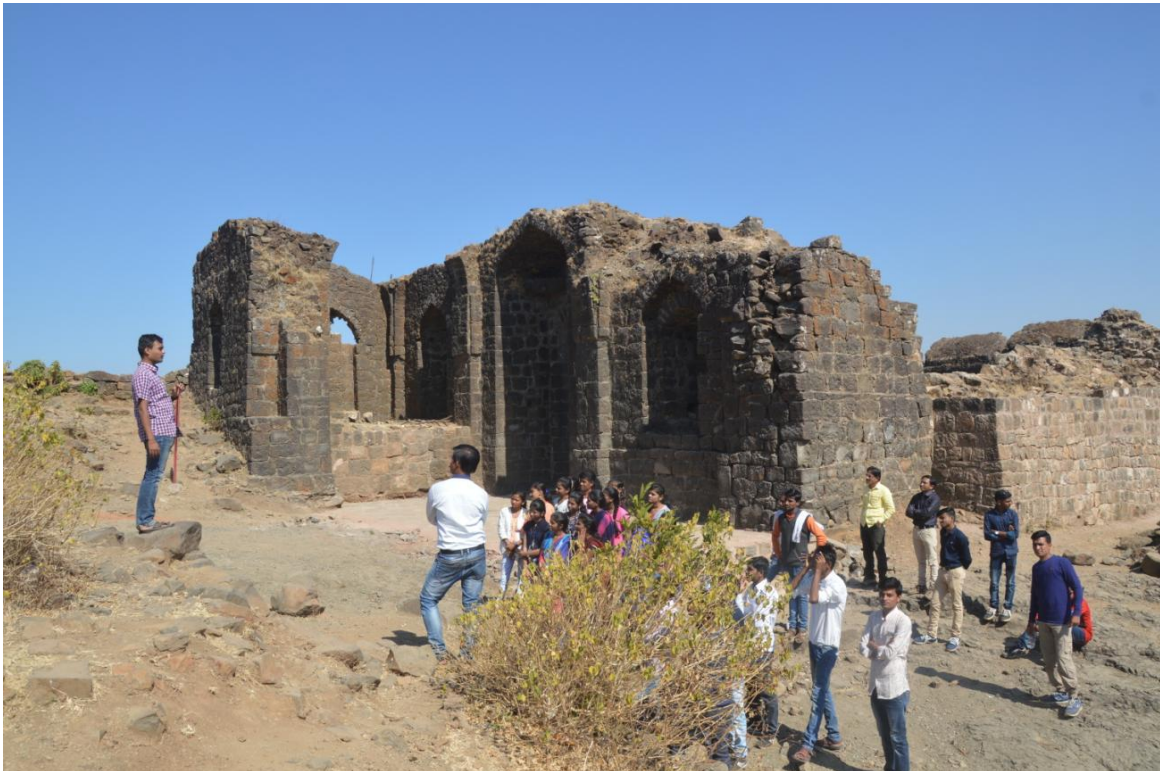
Study tour Chikhaldara 2018