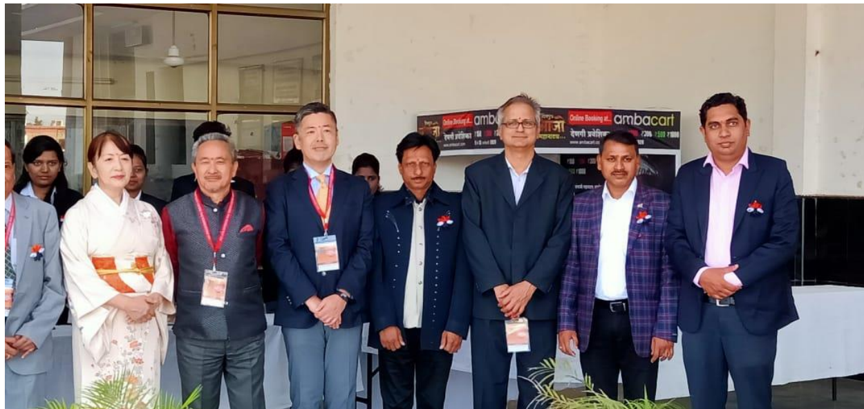
Inspiring Japan at Sant Dnyaneshwar Sabhagruh Amravati Feb. 2020