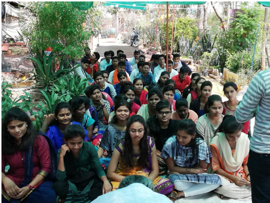
Nature Study 2018