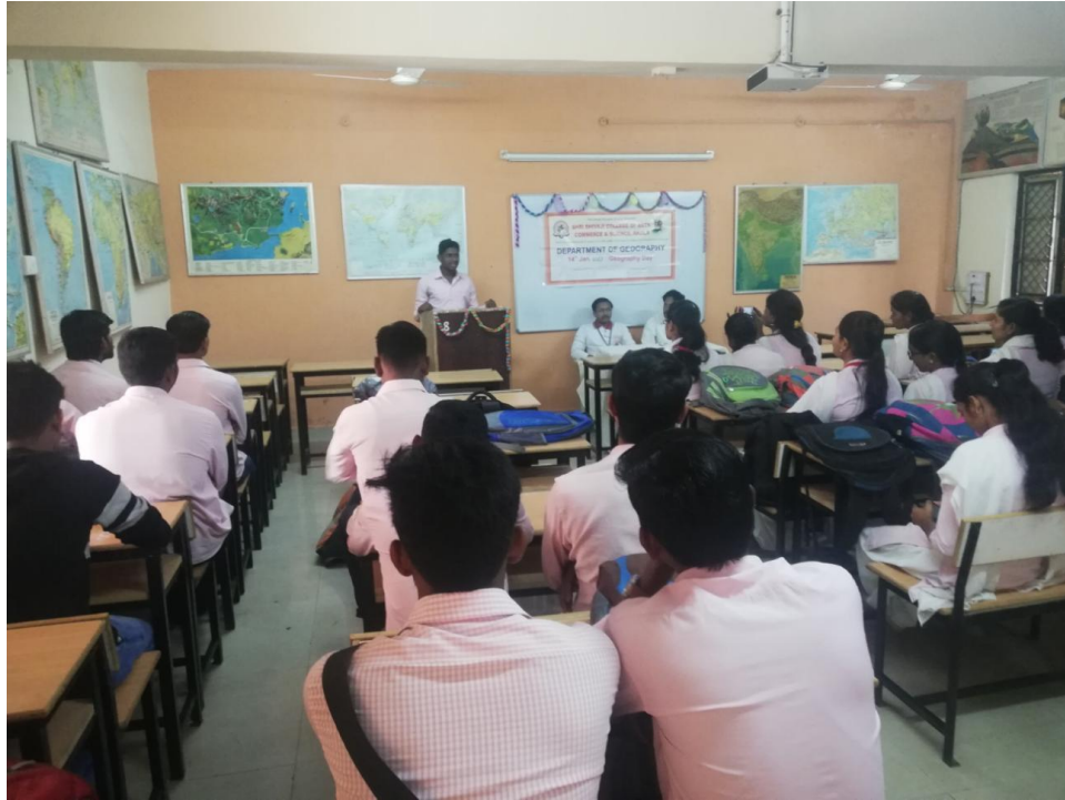
Geography Day 2019