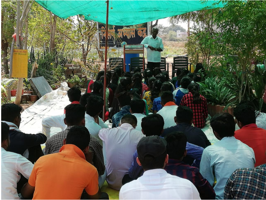
Nature Study 2018