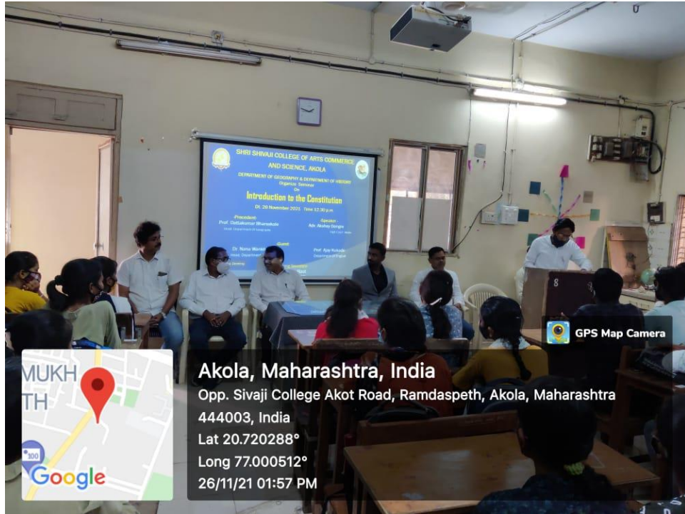
Seminar on ' Introduction to Constitution Nov. 2020