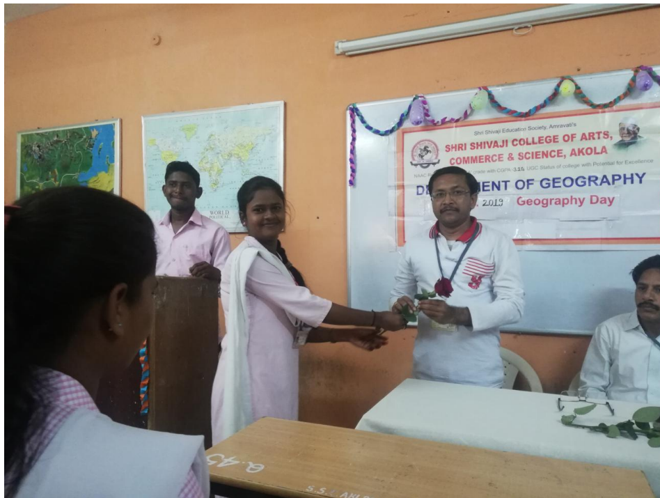
Geography Day 2019