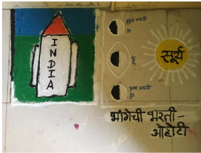
Rangoli by the Students on Geography Day 2020