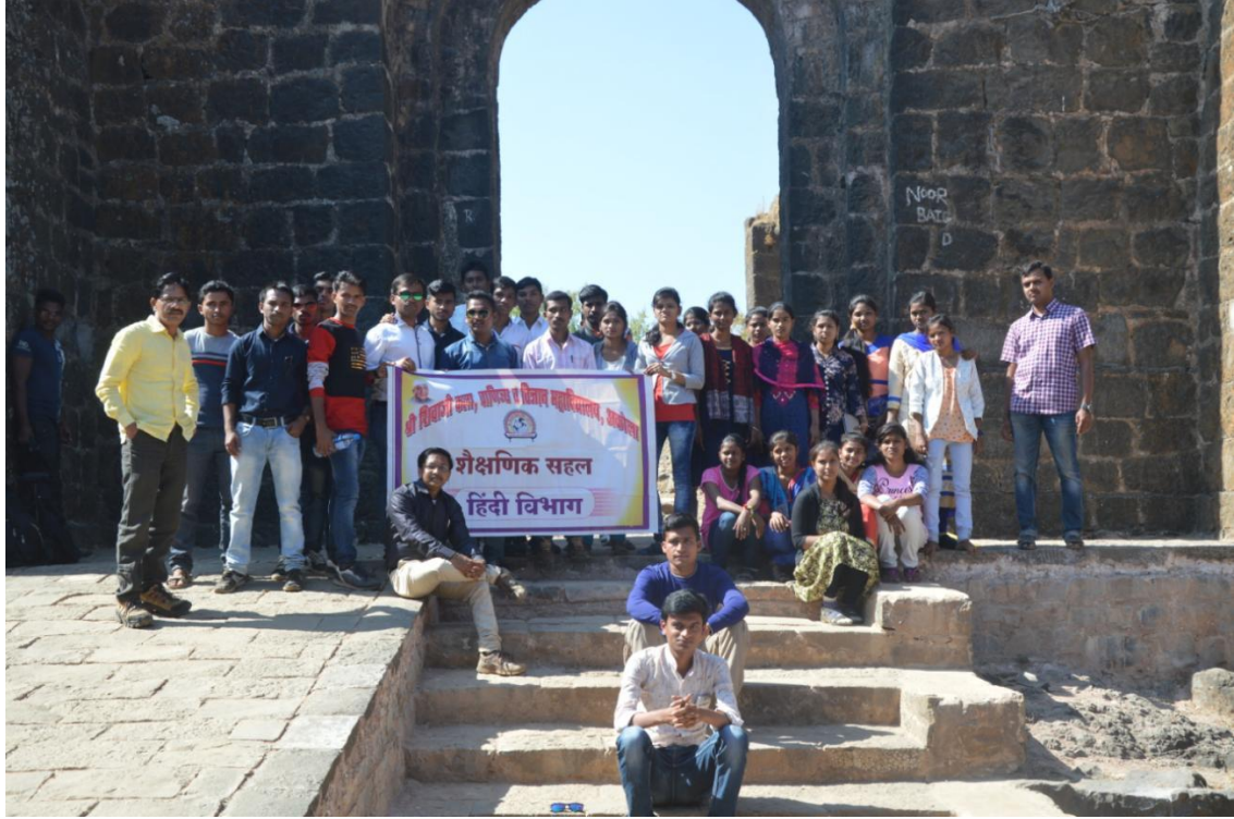
Study Tour at Chikhaldara 2018